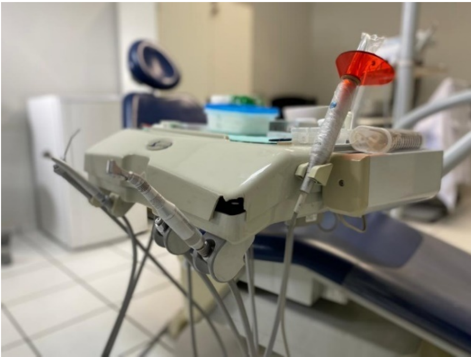
3 – Imagem da cadeira odontológica rasgada pelo uso e ação de tempo: