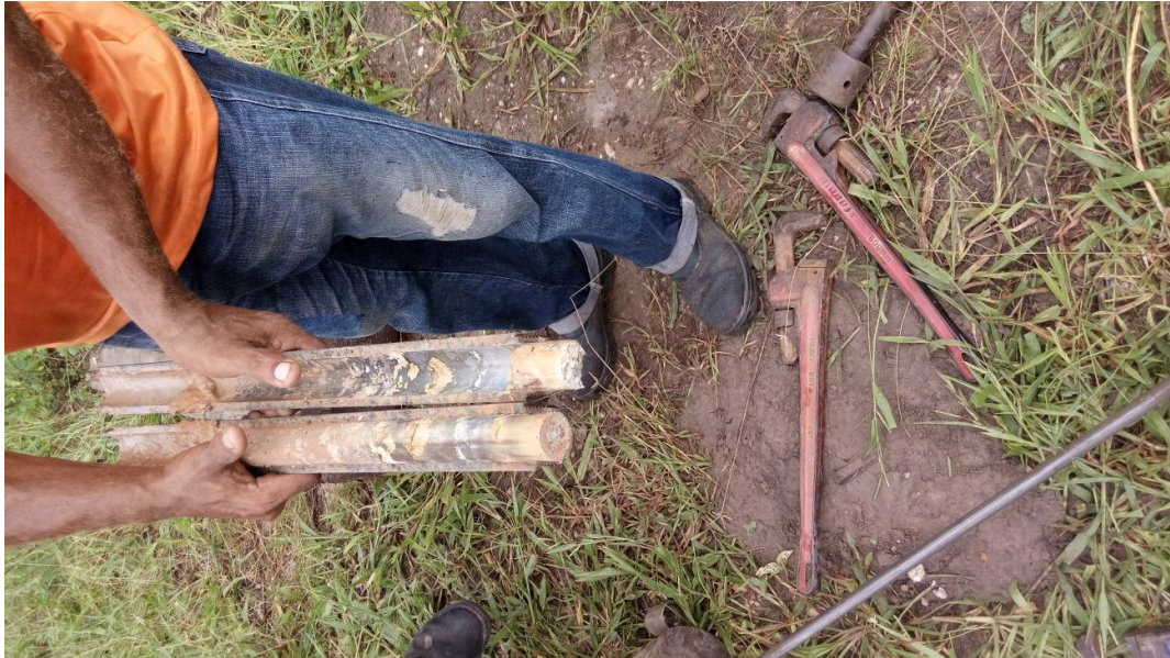
SPT 5 – coletando amostra 16/03/2017